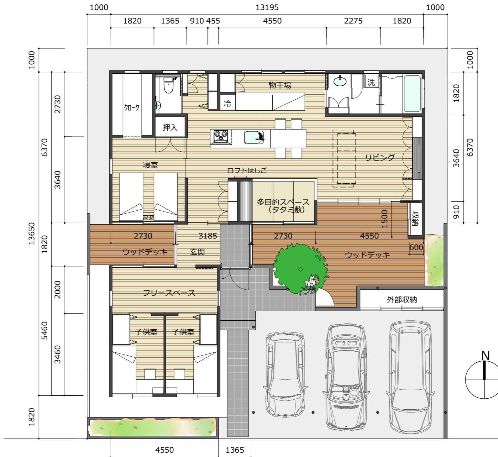
1階平面図 S = 1 : 100