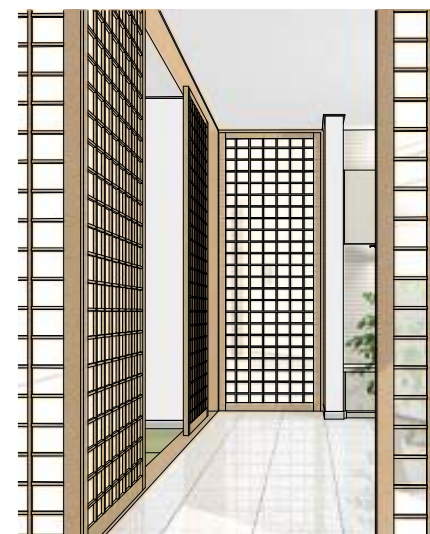
ダイニングよりリビングを見る