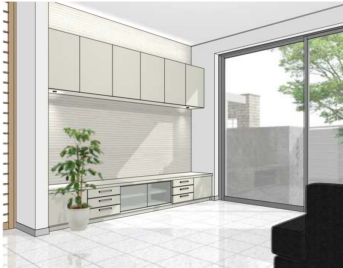
リビング内観パース