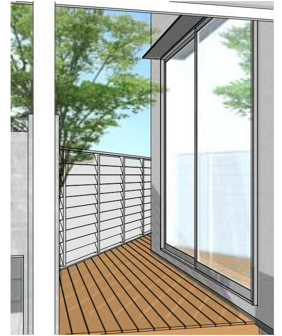
カーポートよりウッドデッキをみる