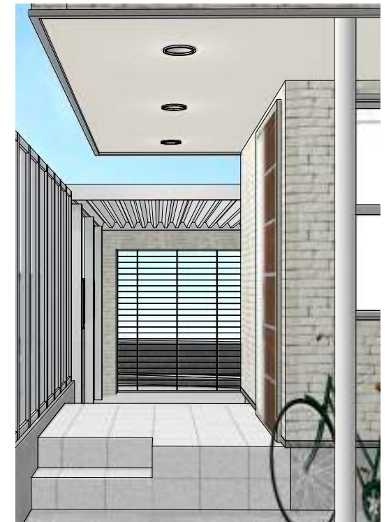
駐輪スペースより玄関ポーチをみる